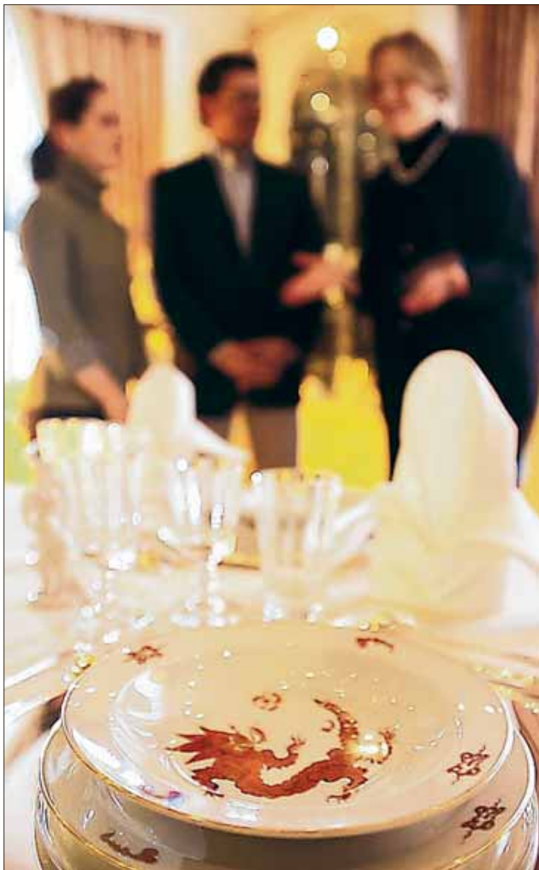
Wie isst man an einer gedeckten Tafel, wer geht zuerst durch die Tür, was ist höflich – Donata Gräfin Fugger gibt in der heute startenden AZ-Serie „Etikette aktuell“ jeden Samstag Lesern Benimm-Tipps und beantwortet sogar Fragen zur Etikette.