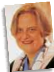
ETIKETTE AKTUELL mit Gräfin Fugger und der AZ

■ www.sales-motion.de/etikette , augsbu-ger-allgemeine.de/etikette Hier finden Sie mehr Infos zum Thema Etikette.